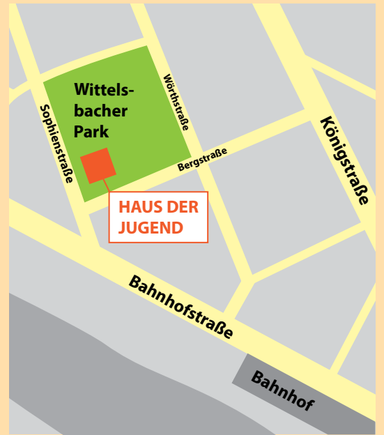
HAUS DER JUGEND, Sophienstr. 23, 95028 Hof

„HAUS DER JUGEND Sophienstr.23 / 95028 Hof“ مساءً من الساعة ٧:٠٠ حتى الساعة ٩:٠٠ في كل مرة.